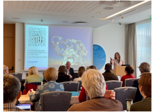
Kynning á Iffro ráðstefnu í október 2023.