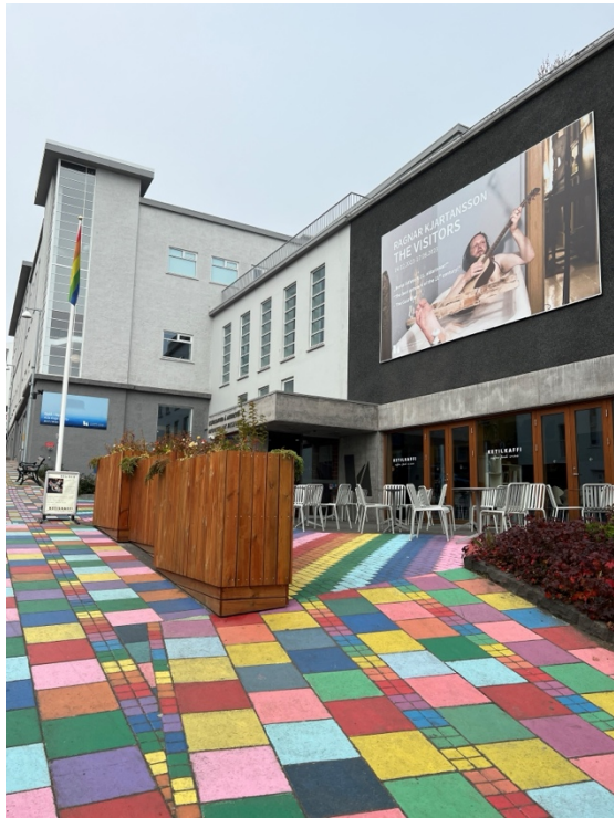
Fundur á Listasafni Akureyrar í ágúst.