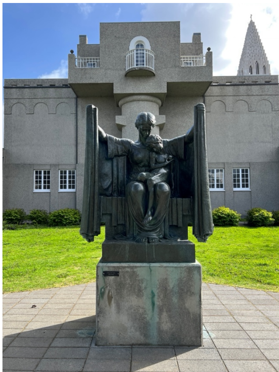
Listasafn Einars Jónssonar