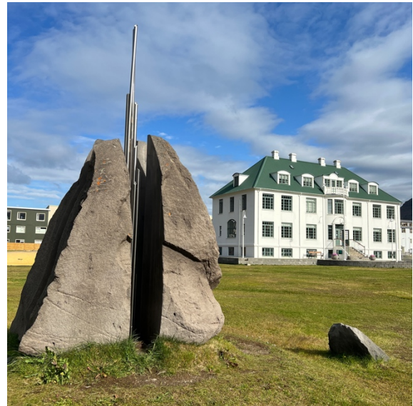
Fundur með Listasafni Ísafjarðar í september.