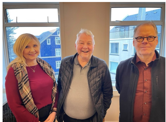
Undirritun safnasamnings við Listasafn HÍ