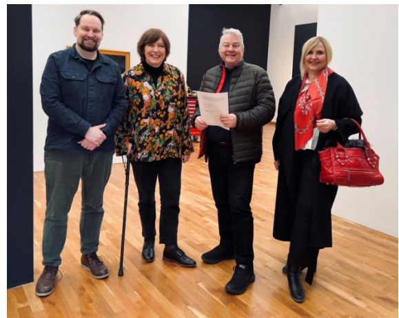
Undirritun safnasamnings við Listasafn Reykjavíkur